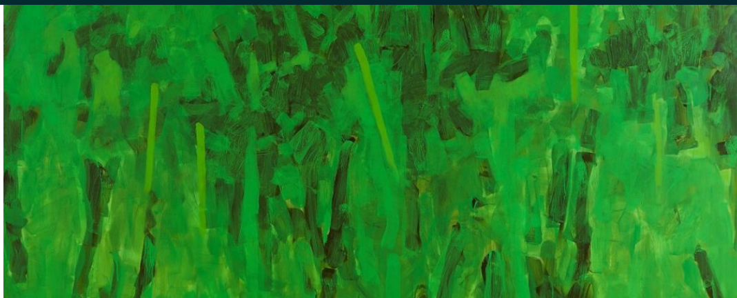
Vert Terrestre , de Piotr Klemensiewicz

Cette exposition est également l'occasion de venir découvrir l' Hôtel de Tingry , magnifique hôtel particulier du 18ème siècle, dans lequel sont régulièrement organisés divers événements comme des concerts de jazz, des expositions ou encore des conférences. Des chambres sont également disponibles à la location et il est possible de privatiser le lieu. L'Hôtel de Tingry appartient à la Fondation Nancy B. Negley , tout comme La Maison Dora Maar , lieu de résidence d'artistes qui se trouve juste à côté, et dont Piotr Klemensiewicz a lui-même été pensionnaire en 2008.