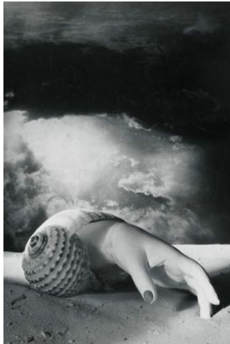
Sans titre [Main-coquillage], Dora Maar (vers 1934)

À travers une scénographie plurisensorielle imaginée par CreativeTech , le visiteur est véritablement transporté dans les imaginaires des artistes ayant puisé leur inspiration au coeur de cette maison au fil du temps. L'exposition est visible à la galerie La Mob , située au rez-de-chaussée de la Maison Dora Maar. Elle a débuté le 28 octobre dernier et se poursuivra jusqu'à la fin du mois de mars 2023, mois de la poésie.