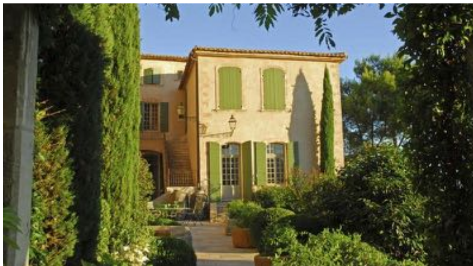
La Maison Dora Maar